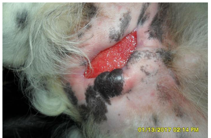
13 januari 2017. 22 dagen nadat Bo in de machine is terecht gekomen