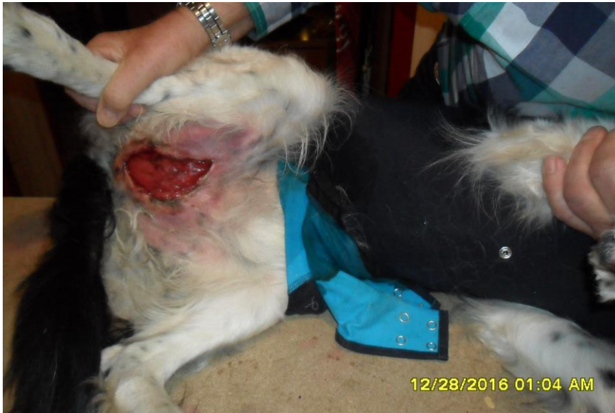
28 december 2016.