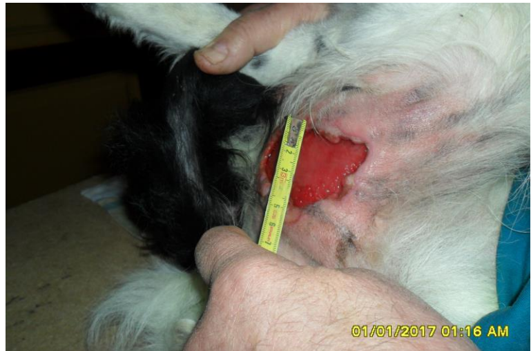
1 januari 2017. De wond is nu ongeveer 7cm bij 5cm.