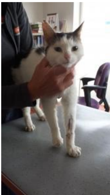
Prik na de behandeling

De familie die haar binnen heeft gebracht heeft besloten om voor haar te gaan zorgen, was een prachtig einde aan een bijzonder verhaal.